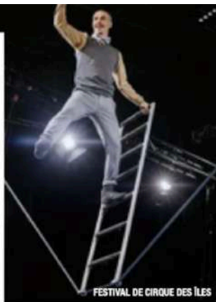
FESTIVAL DE CIRQUE DES ÎLES

Vous aurez assurément le «Fau Mau» si vous n'assistez pas à cet événement, qui en est à sa troisième édition. La Haute-Gaspésie accueillera des festivaliers avides de musique et d'air salin. DVTR, Galaxie, Taxi Girls et VioleTT Pi font entre autres partie des artistes qu'on ne veut pas manquer. Plusieurs spectacles seront aussi offerts gratuitement à la Microbrasserie Le Malbord, comme celui d'Allô Fantôme – la révélation Radio-Canada chanson pop 2025 –, tandis que ceux de Luan Larobina, d'Oli Féra et de Margaret Tracteur auront lieu à l'Auberge la Seigneurie des Monts. On lâche son fou en laissant échapper le fauve en soi lors de cette programmation festive et éclectique! fauve-mauve.com