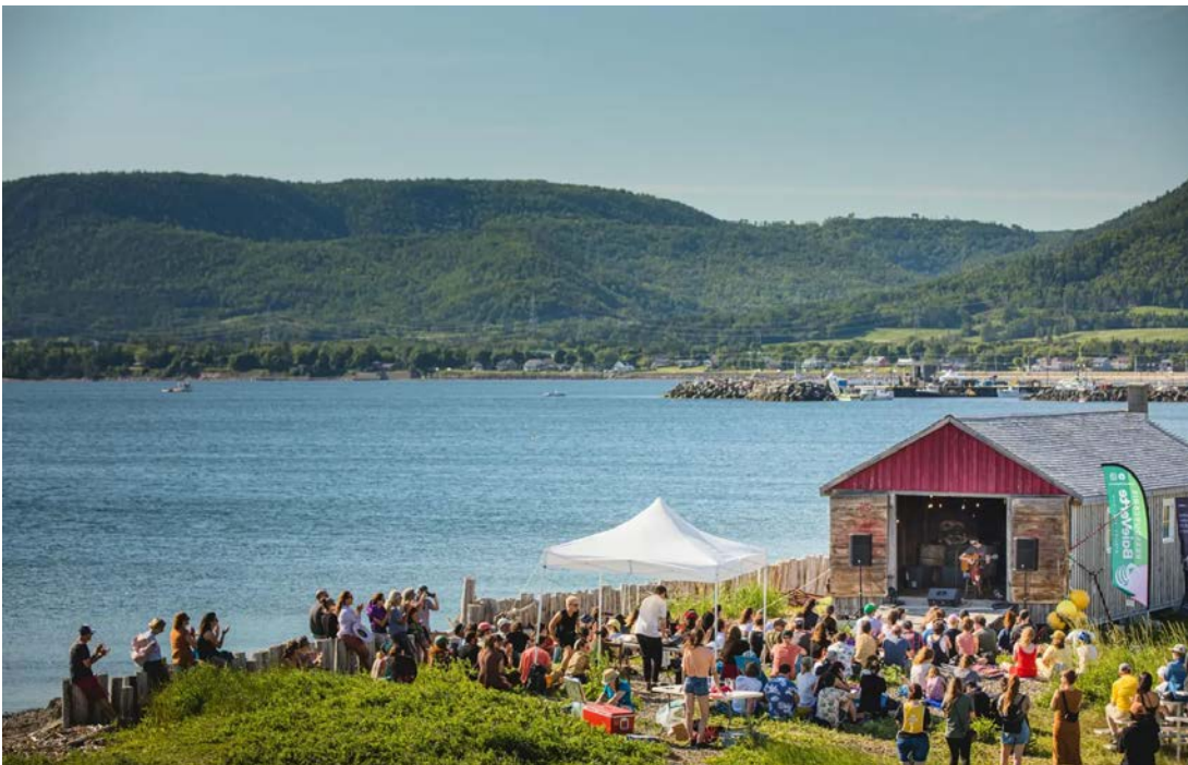
Autour de la Saint-Jean, la Baie-des-Chaleurs accueille le jeune festival BleuBleu.

Ce texte fait partie du cahier spécial C'est l'été